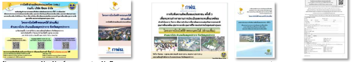
ป้ายประชาสัมพันธ์ แผ่นพับโครงการฯ เอกสารประกอบการรับฟังความคิดเห็นฯ แบบแสดงความคิดเห็นฯ